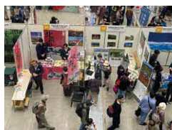
2023年八王子フェスの様子

展示ブースや体験ブースをめぐって全国の日本遺産に出会おう! ブースでは各地の日本遺産にちなんだ名産品などの販売も。